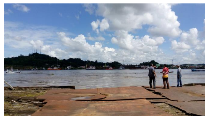
傍に流れるマハカム川