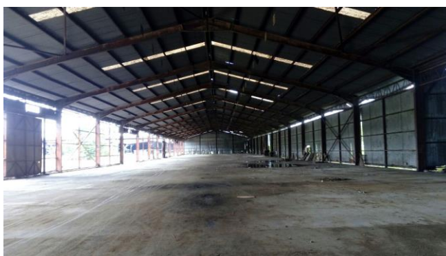
ストックパイル建設予定地